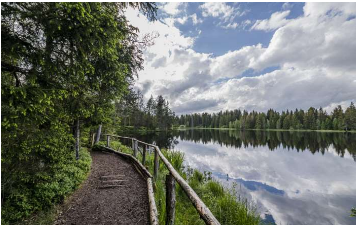
Sur les bords de l'étang de la Gruère