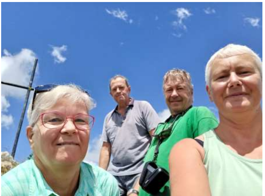
Au sommet du Noirmont