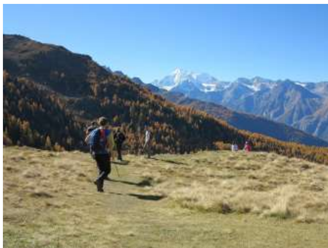
Höhenweg de Giv