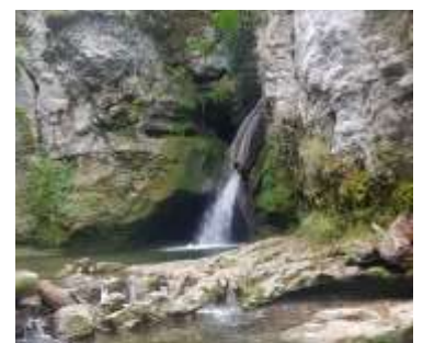
La Tine de Conflens

Inscription jusqu'au 23 septembre au 079 819 68 28 où christianmariethoz03@gmail.com