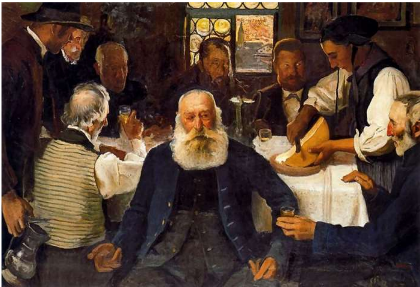
Ernest Biéler les comptes de l'alpage ou la raclette, 1903