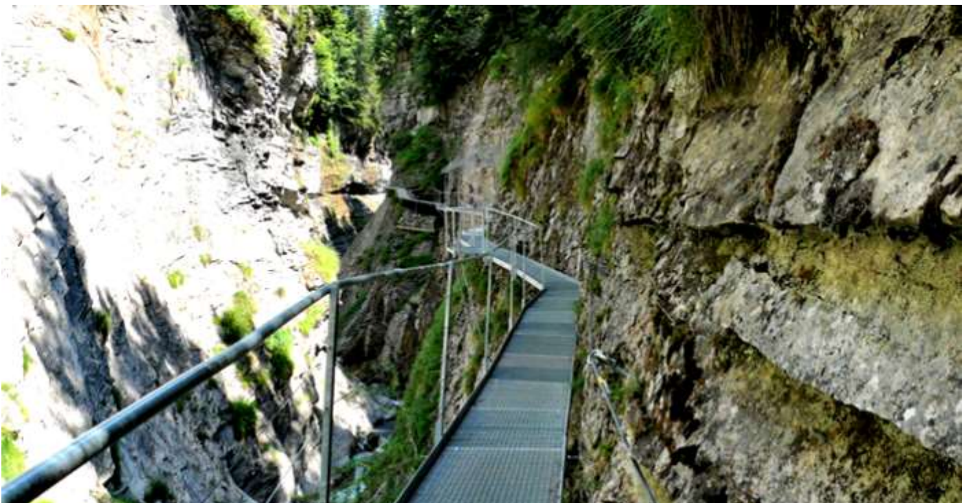
Les gorges de la Dala