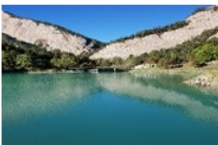
De Binn à Ernen

Infos et inscriptions jusqu'au 7 juin auprès de Kiki Antenen : 079 899 11 59