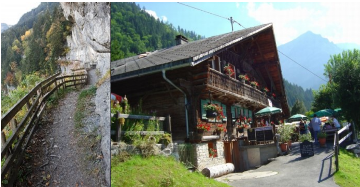
Le chemin de la galerie Defago nous mènera à la Cantine des rives...