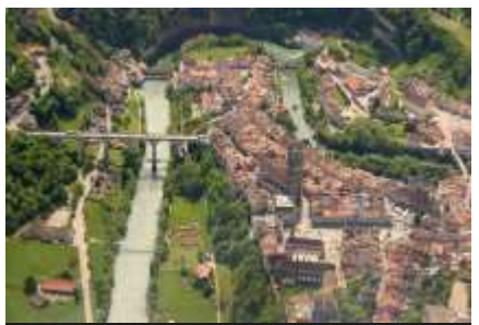
Balade à Fribourg