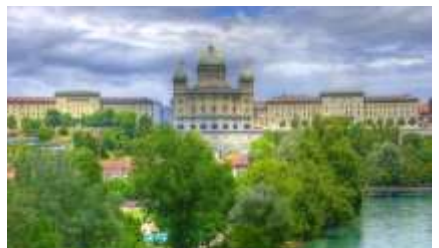
Balade à Berne

Jeudi 25 octobre, visite des enceintes et tours de Fribourg