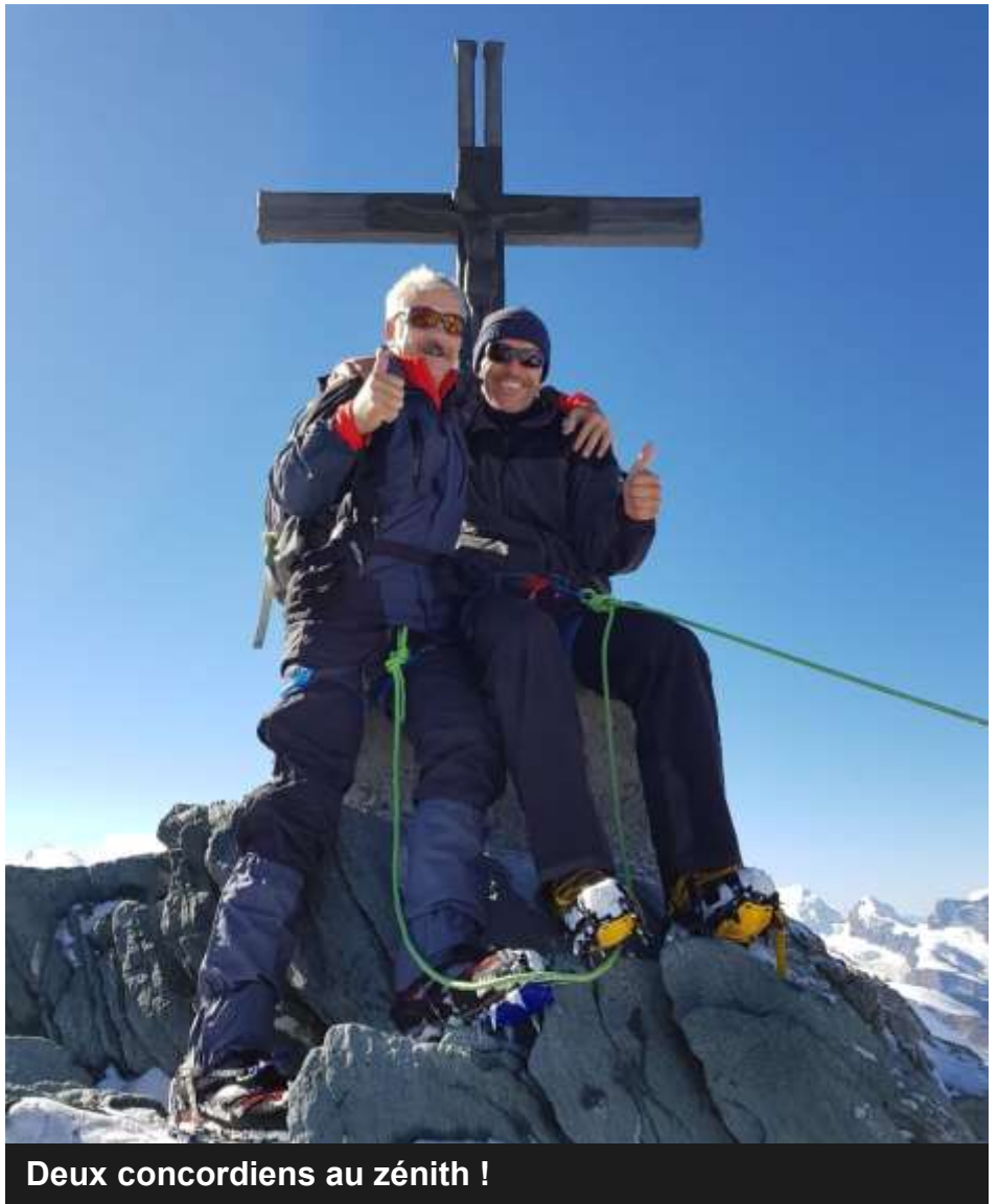
Deux concordiens au zénith !