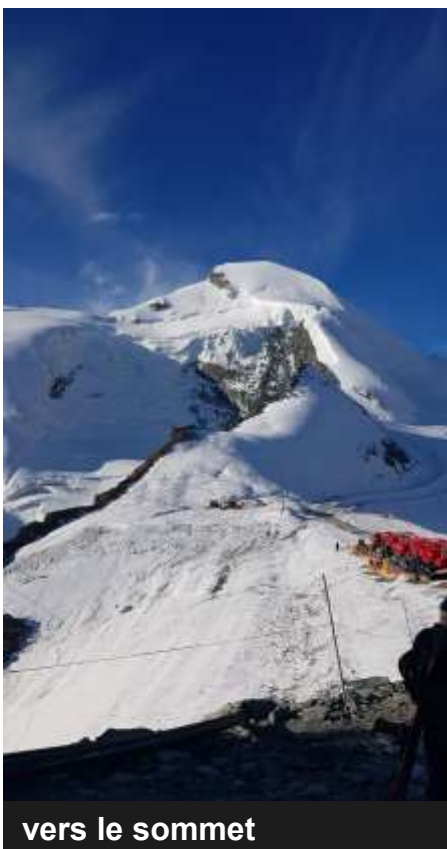
vers le sommet

tro alpin, nous sommes arrivés, dans la neige, laissées par pas trop épuisés au départ de la d'autres groupes. L'appareil res- course à presque 3500 mètres piratoire avait un gros travail à d'altitude. Pour la suite, il fallait fournir, mais après deux heures mettre les crampons et se sécu- et demi de montée, on mettait riser avec la corde. Un panora les pieds au sommet. Il fallait ma fantastique avec une vue voir les deux Concordiens heu- qu'on ne peut pas décrire nous reux qui s'embrassaient et sur- accompagnait jusqu'au sommet tout admiraient les autres d'Allalin. Les températures qui 4000...du valais (Monte Rosa, augmentent sur notre terre ne Cervin et même le Mont Blanc). font pas d'arrêt dans notre ré- Mais malheureusement ce mo- gion. Le glacier qu'on pénétrait- ment au sommet d'Allalin arri- nous présentait ses crevasses, vait à sa fin et le groupe atta- et on s'est demandé, à long quait la descente pour regagner terme... Saas Fee vers 14:30. Attention, Un petit passage avec une les deux Concordiens y ont pris échelle de dix mètres de hau- goût :) ... teur, sinon, on suivait les traces