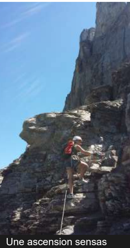
Une ascension sensas

Équipement nécessaire : un casque et un harnais d'escalade, une longe spécifique, équipée de deux mousquetons de sécurité et d'un absorbeur de choc (location possible à la Petite Scheidegg : 20.-)