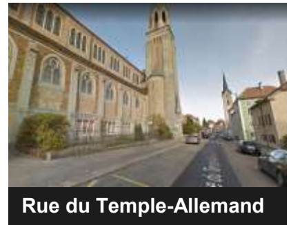
Rue du Temple-Allemand