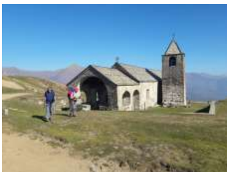
Oratorio di San Lucio

Après 3 heures de marche, le Passodi San Lucio est atteint, lieu de rendez-vous avec la route du haut. Une jolie chapelle avec deux restaurants, l'italien et le Suisse. On choisit