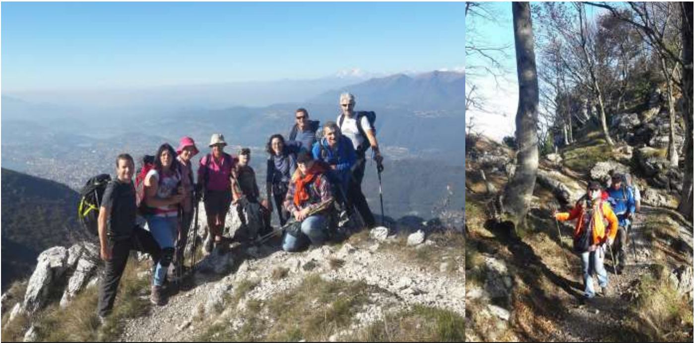
Une belle équipe par monts et par vaux sous un ciel d'azur...

ce dernier vu notre patriotisme. La liaison est à nouveau faite entre les troupes d'élites et la classe touriste. Par contre, ce qui s'est dit sur ces sentiers reste un secret... La pause de midi est bien agréable avec des chaises longues, dur de repartir ! Nous longeons la frontière, les bornes nous indiquent avec précision de quel côté on se trouve. Au lieu dit Bocchetta di San Bernardo, encore deux variantes au choix avec une passant par les crêtes, mais surprise, le meneur se trompe de parcours, hi hi hi ! Résultat tout le monde se retrouve sur le même parcours. La frustration ne dure pas longtemps, les rigolades reprennent le dessus.