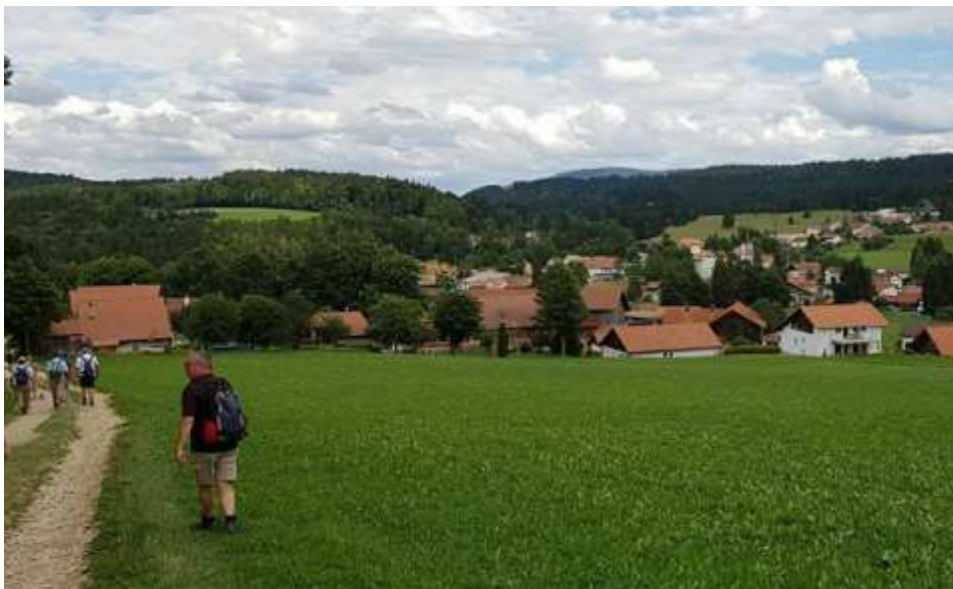
Paysage de carte postale dans l'Ajoie