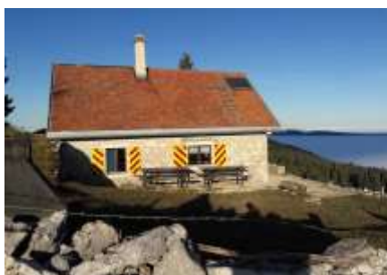
Menu chasse au Fiottet

Détails dans le bulletin 193 Inscriptions auprès de Jacques 079 368 32 46 kybus@bluewin.ch