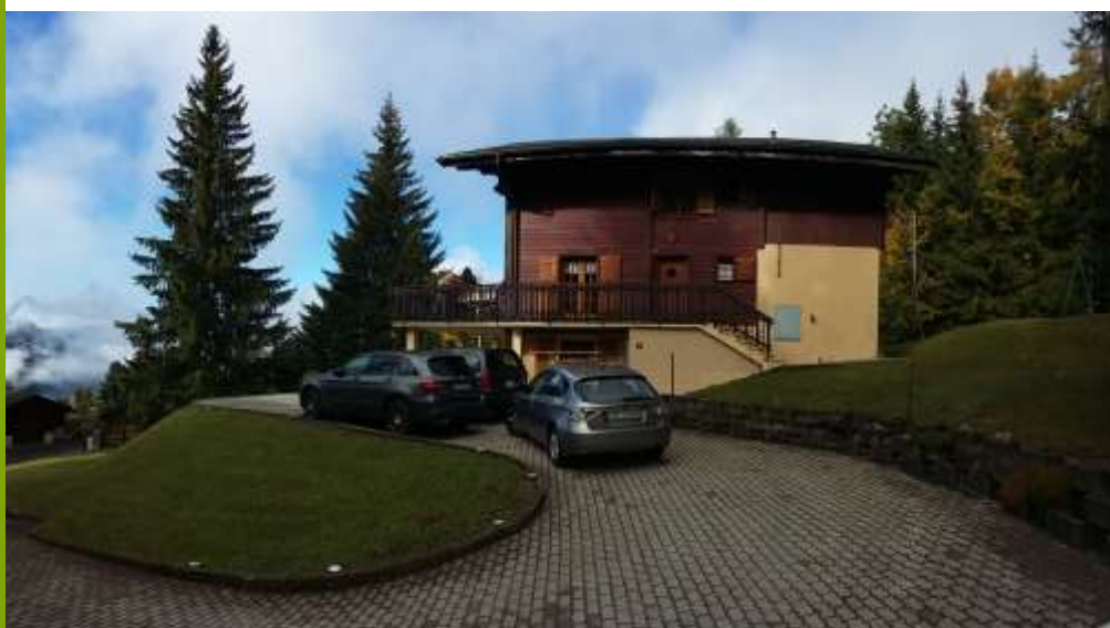
Un chalet resplendissant sous le soleil d'automne

Samedi 24 mars Assemblée Générale La Chaux de Fonds Sect. NE / Comité de section