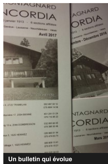
Un bulletin qui évolue

Mardi 19 septembre Louwenetal LS / B. Schäfer Jeudi 28 septembre Sortie du président central BI / P. Curty Vendredi 29 septembre Corvées d'automne CC / J.-L. Cachin Samedi 30 septembre Comité étendu Au chalet à Barboleusaz CC