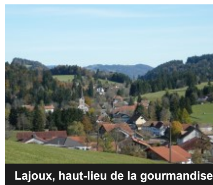
Lajoux, haut-lieu de la gourmandise