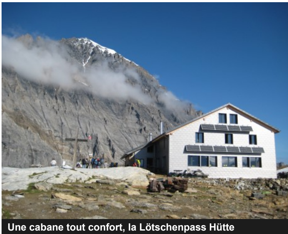
Une cabane tout confort, la Lötschenpass Hütte