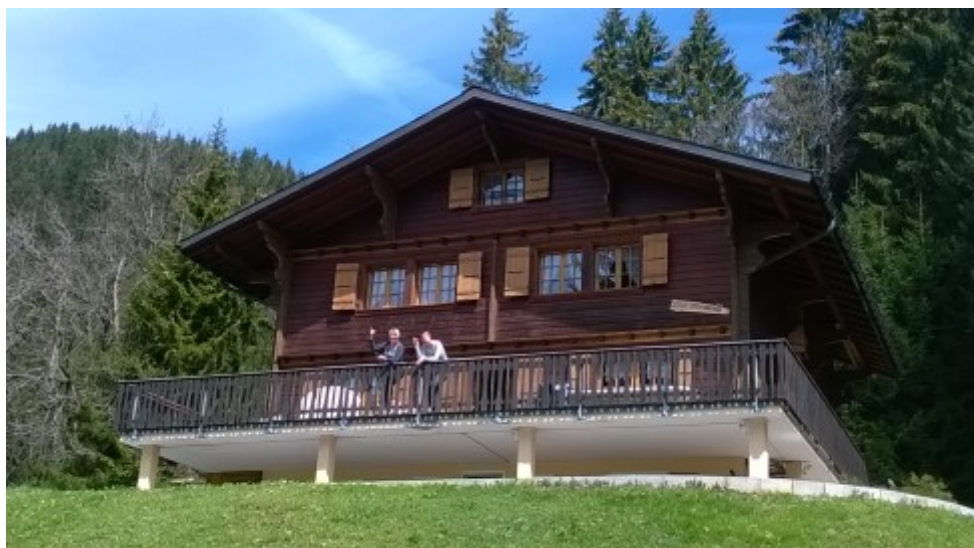
Un chalet prêt à attaquer sa saison estivale

La lisibilité de ce numéro devrait être plus aisée avec cette nouvelle taille d'écriture.