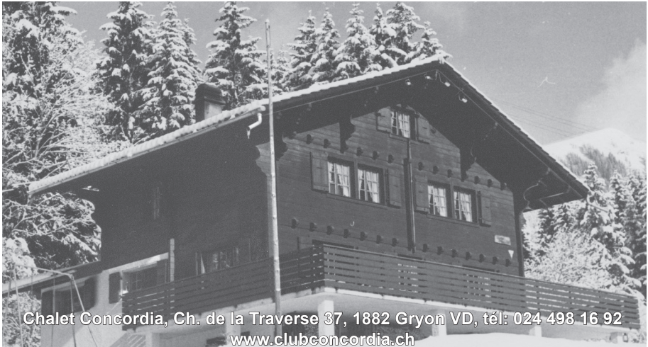
Chalet Concordia, Ch. de la Traverse 37, 1882 Gryon VD, tél: 024 498 16 92 www.clubconcordia.ch