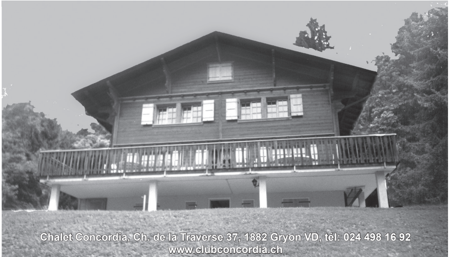
Chalet Concordia, Ch. de la Traverse 37, 1882 Gryon VD, tél: 024 498 16 92 www.clubconcordia.ch