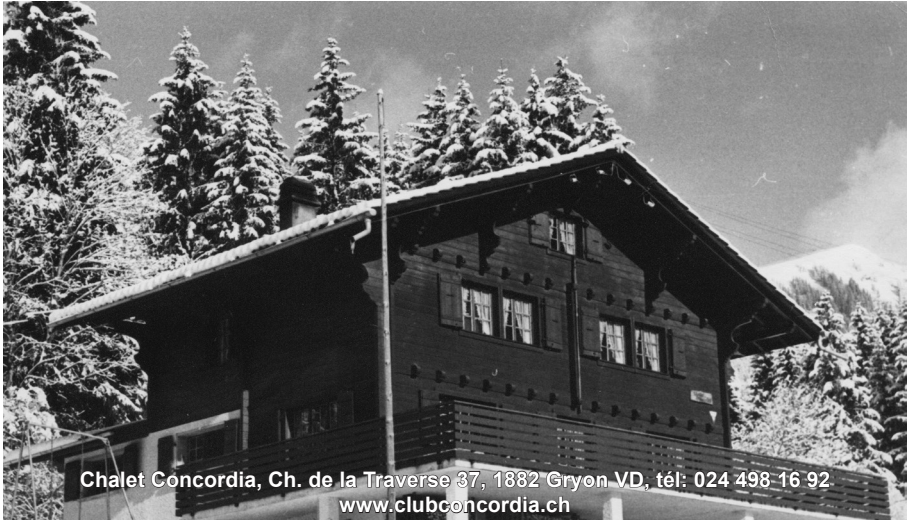
Chalet Concordia, Ch. de la Traverse 37, 1882 Gryon VD, tél: 024 498 16 92. www.clubconcordia.ch