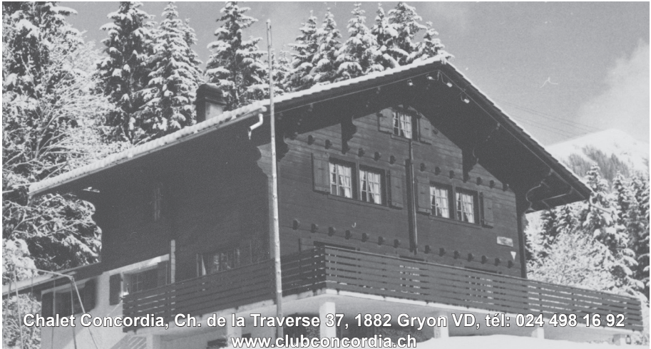
Chalet Concordia, Ch. de la Traverse 37, 1882 Gryon VD, tél: 024 498 16 92 www.clubconcordia.ch